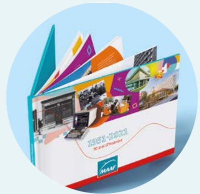
Toute l'histoire de MAAF retracée dans une édition limitée.