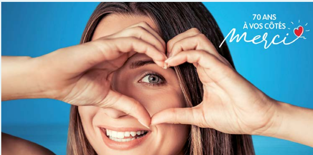
Une belle aventure partagée avec nos clients.