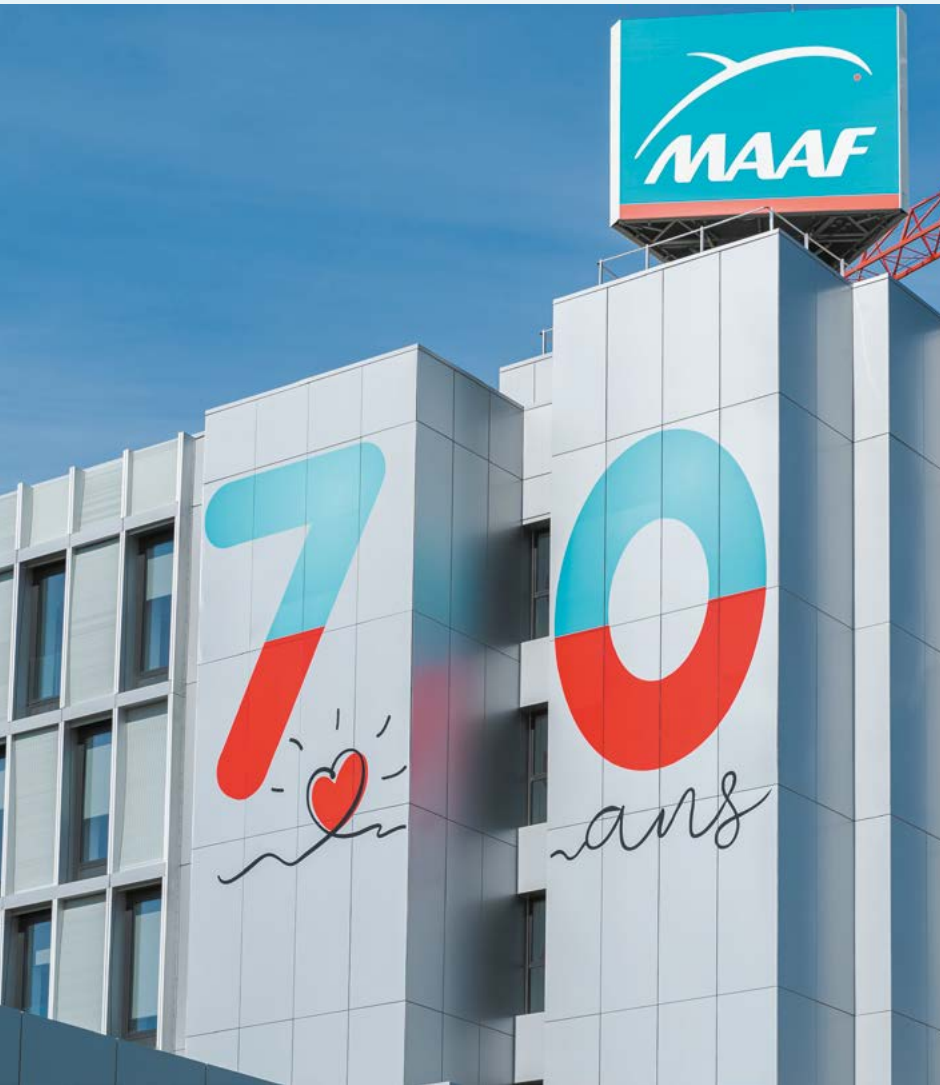
Le siège social de MAAF à Chaban de Chauray, qui jouxte Niort, inauguré en mai 1972.